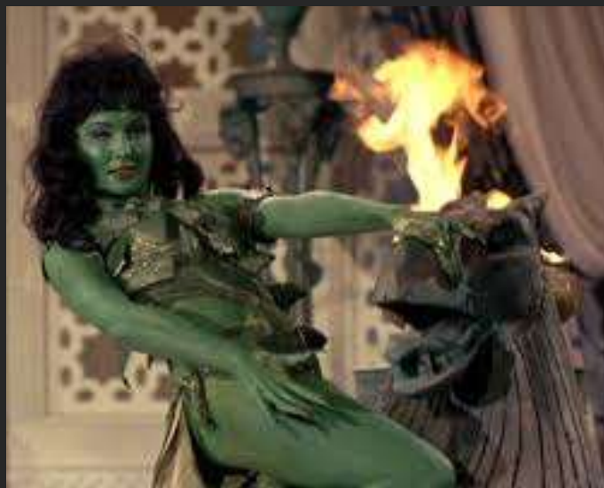
Vina, la seule et vraie Miss Hulk !

Plagiat de la part de Disney – En 2022, Marvel a prévu de lancer sa série sur Miss Hulk (« She-Hulk » en anglais). Mais comme ce personnage ne date que de 1980, CBS affirme que le design du personnage lui appartient, sous l'apparence des Orionnes. Les avocats de CBS ont affirmé accepter que le personnage apparaisse, mais dans le respect des contraintes édictées envers tout fan-film Star Trek : la série ne comptera donc que deux épisodes de 15 minutes chacun, et devra être sous-titrée « A Star Trek Fan Production ». Non mais oh !